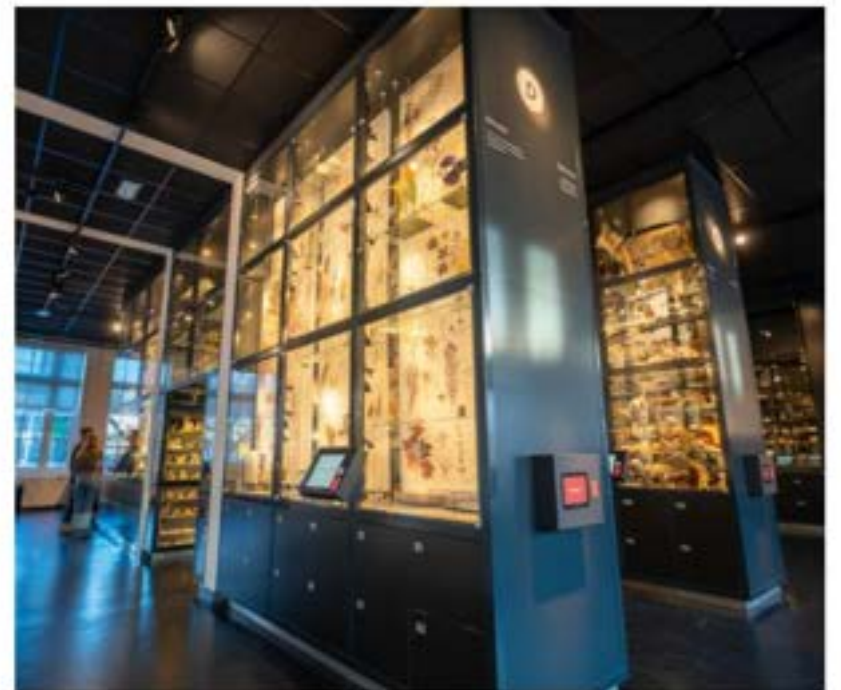
Referentiebeeld Zichtdepot en interactie