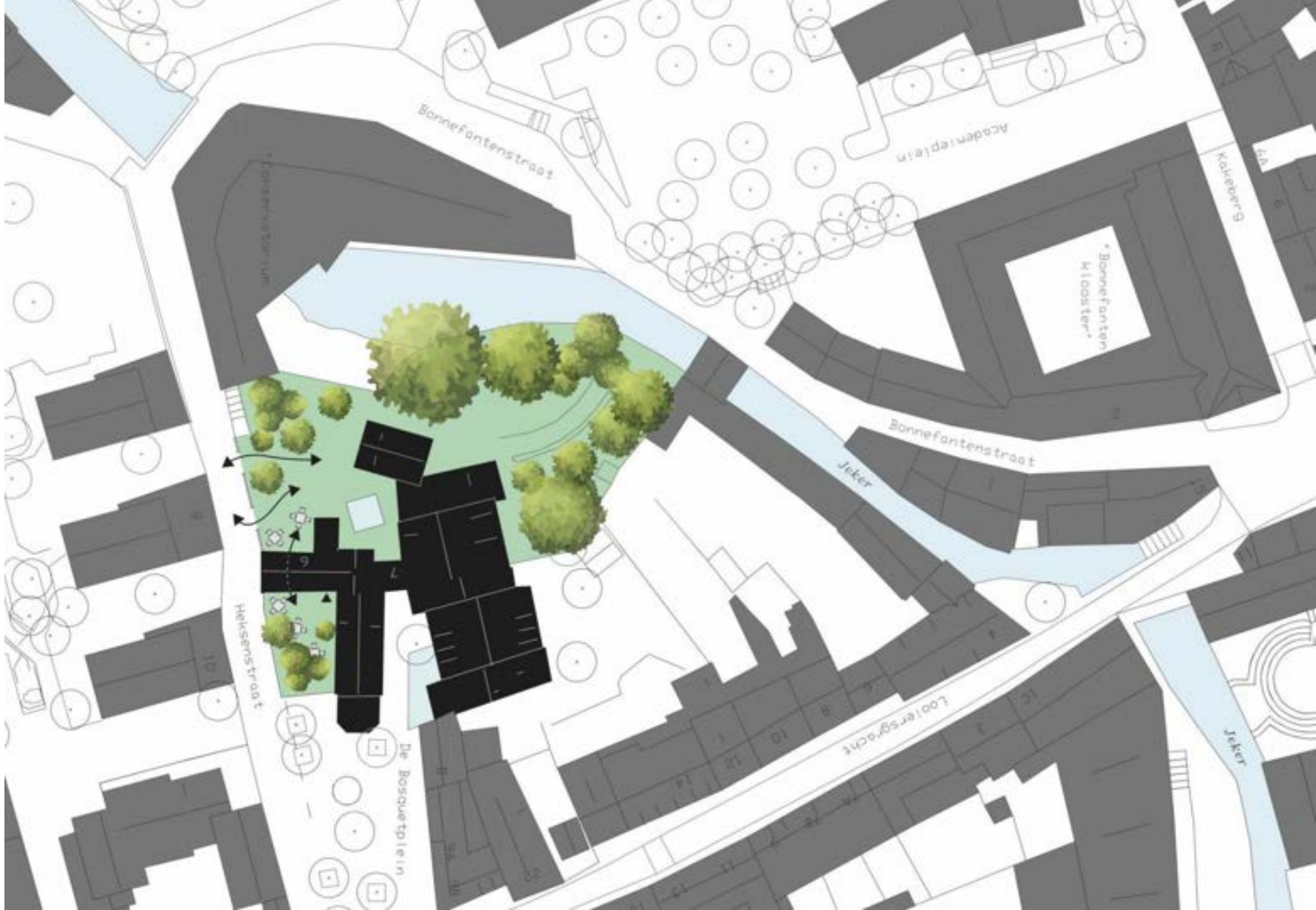
Context: in stad, aan Jeker met Jekertuin